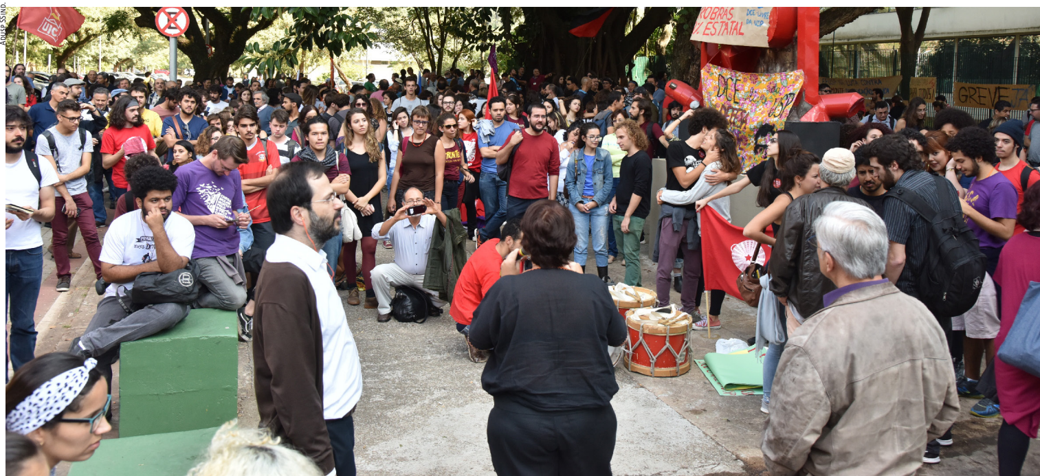
No primeiro dia de greve, docentes da USP realizam manifestação contra a proposta do Cruesp de 1,5% de reajuste salarial.

capital privado. Em Mossoró, a programação ocorreu no Centro de Convivência do Campus Central.