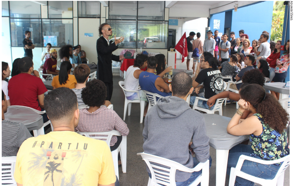
Professores da Uneb participaram de roda de conversa na Semana Nacional de Lutas

Música e poesia de resistência também ocuparam o campus da Universidade Estadual do Sudoeste da Bahia (Uesb), em Vitória da Conquista, no dia 22. O Sarau "Ueba Resistem" fez parte das atividades da Semana de Lutas das Iees e Imes do ANDES-SN e do Fórum das ADs. Durante a programação, docentes e estudantes fizeram falas sobre a conjuntura política nacional, a indisposição do governo Rui Costa para negociar e os cortes orçamen-